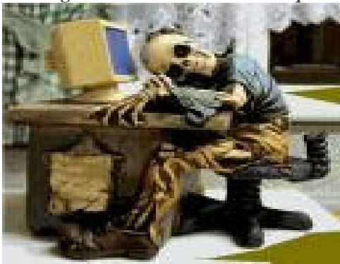
figura 1- Vida eterna com a maquina